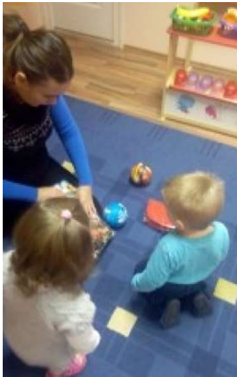
Kép a csoportszobáról

Virágos Gyermekert Egyesület Családi Bölcsődei Hálózat CSIPERKE 1. CSALÁDI BÖLCSŐDE - Szakmai Programja 8000 Székesfehérvár, Csóri Sándor u. 32.