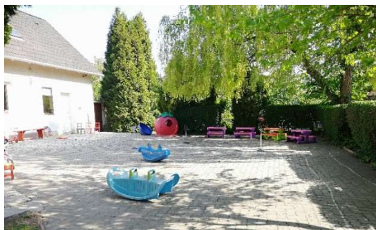
Csoportszobák előtti teraszrész