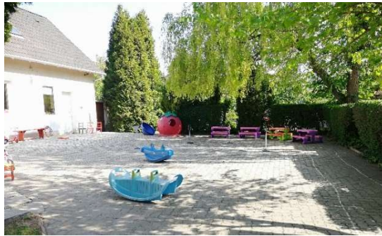
Csoportszobák előtti teraszrész