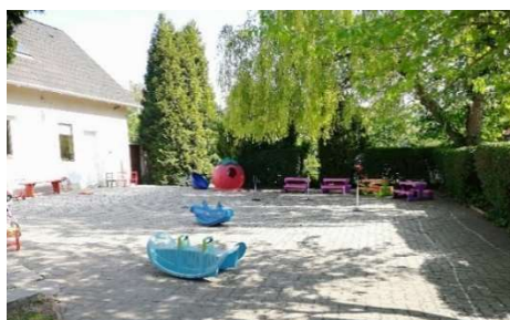
Csoportszobák előtti teraszrész

A csoportszobák előtt nagy tágas terasz lett kialakítva. Közösen használják az óvodásokkal. A családi bölcsődéseknek egy rész leválasztásra kerül. Árnyékolás kialakítása még nem megoldott.