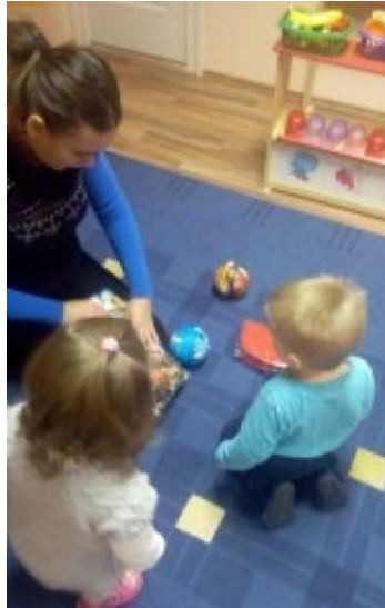
Kép a csoportszobáról

„A szeretet cselekvő törődés annak az életével és fejlődésével, akit szeretünk.” /Erich Fromm/